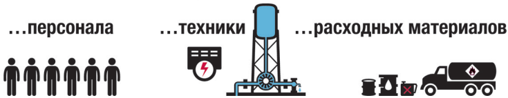
Рис. 1. Три жизненно важных составляющих коммунальных служб: персонал, технические средства и расходные материалы

Коммунальные службы взаимосвязаны. Например, повреждение трансформатора может мгновенно лишить водоснабжения целый жилой район или нарушить нормальную работу больницы, что в свою очередь негативно отразится на здоровье населения. Зачастую гуманитарные организации не располагают ни знаниями, ни возможностями так планировать свои операции, чтобы наилучшим образом учитывать эту взаимосвязь. Необходимо изменить такое положение дел, если гуманитарные организации намерены повысить эффективность помощи, цель которой — смягчить гуманитарные последствия, будь то помощь системе общественного здравоохранения, поддержание источников существования и (или) предотвращение вынужденного перемещения.