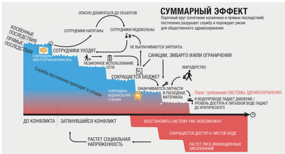
Рис. 2. Суммарный эффект военных действий, влияющий на объекты инфраструктуры, особенно в ходе затяжных конфликтов. Он может породить порочный круг прямых и косвенных последствий, которые приведут к деградации коммунальных служб

ных заболеваний. Такая деградация может усилить изначальную социальную напряженность и еще сильнее раздуть конфликт, который стал ее причиной.