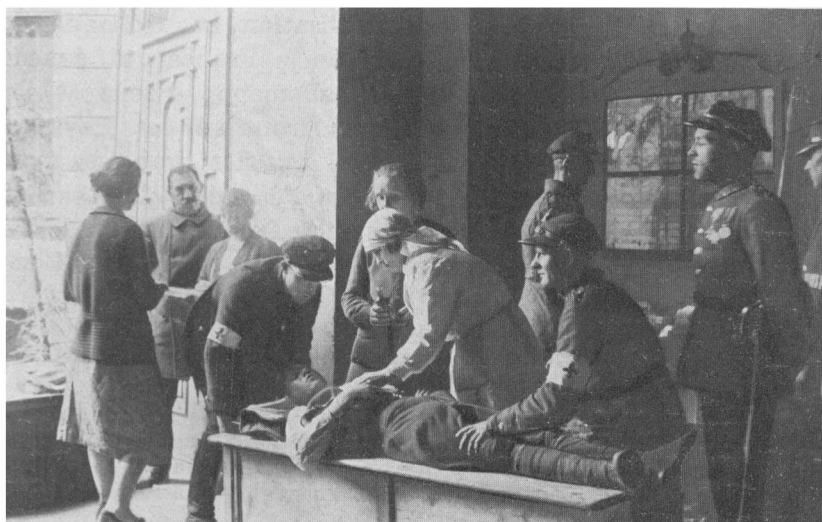
Poste de pansement installé dans une porte cochère.