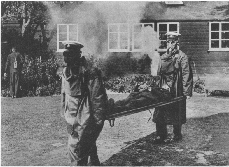
Exercice des détachements d'hommes des V. A. D.