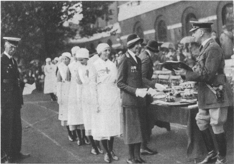
2. Remise des trophées aux équipes gagnantes des concours.